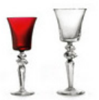
Cristal Saint-Louis Verre à vin, 240 € : verre à eau