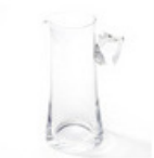
Cristal Saint-Louis 550 €